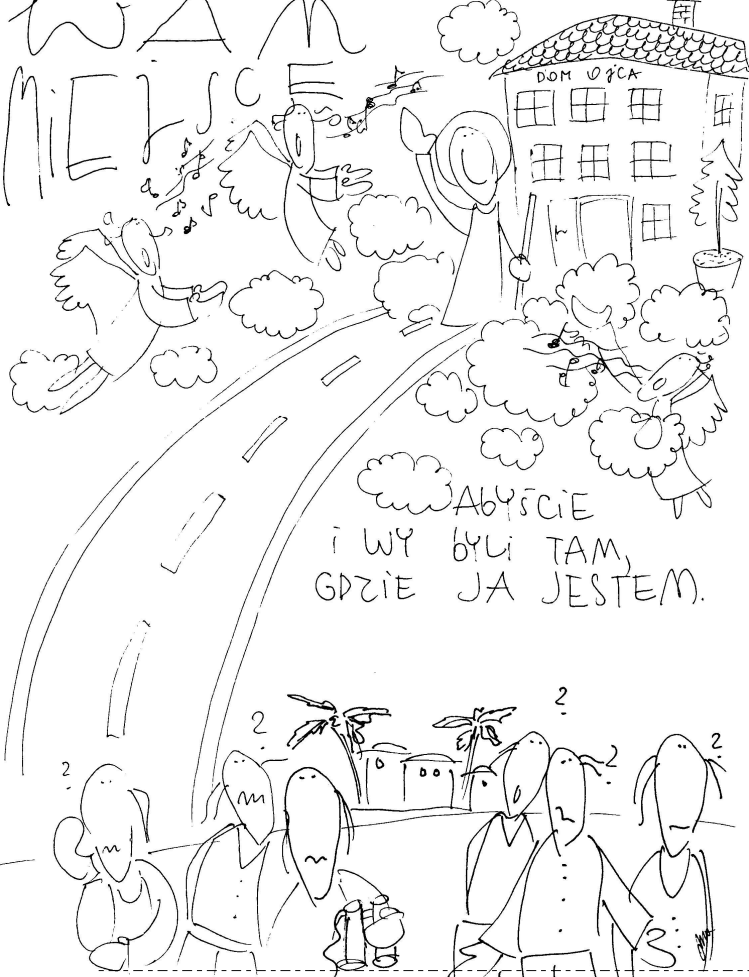
Tu zegnij najpierw - do środka

5 JA JESTEM DROGĄ, PRAWDA i ŻYCIEM. NIKT NIE PRZYCHODZI DO OJCA INACZEJ JAK TYLKO PRZEZE MNIE. GDYBYŚCIE MNIE POZNAŁI, ZNALIBYŚCIE i MOJEGO OJCA. ALE TERAZ JUŻ GO ZNACIE i ZOBACZYLIŚCIE.