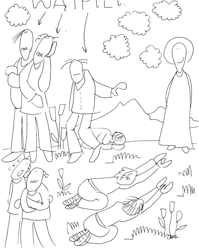
Tu zegnij najpierw - do środka

5) Wtedy Jezus podszedł do nich i powiedział: