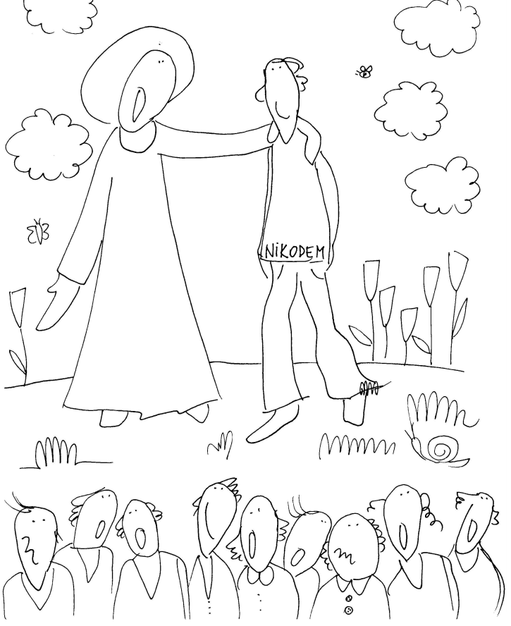
Ewangelia na Uroczystość Trójcy Świętej J 3, 16-18