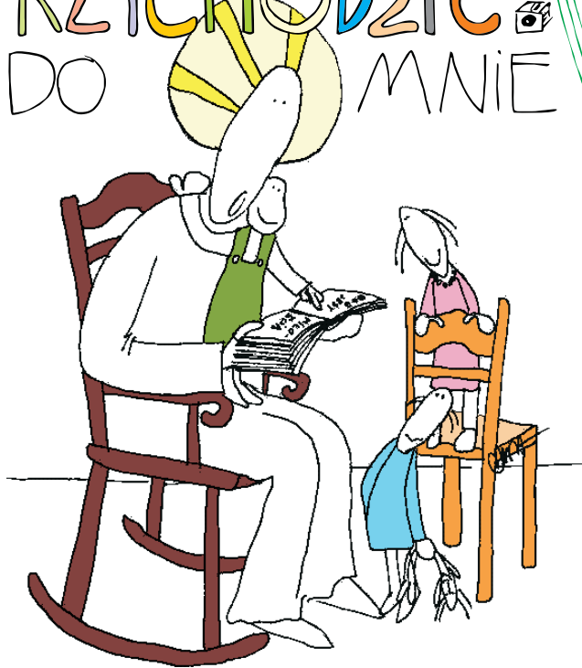
Ewangelia na Trzecią Niedzielę Wielkanocną Łk 24, 13-35