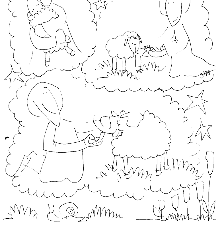
Tu zegnij najpierw - do rodka

5 JA JESTEM DOBRYM PASTERZEM I ZNAM OWCE MOJE, A MOJE MNIE ZNAJĄ