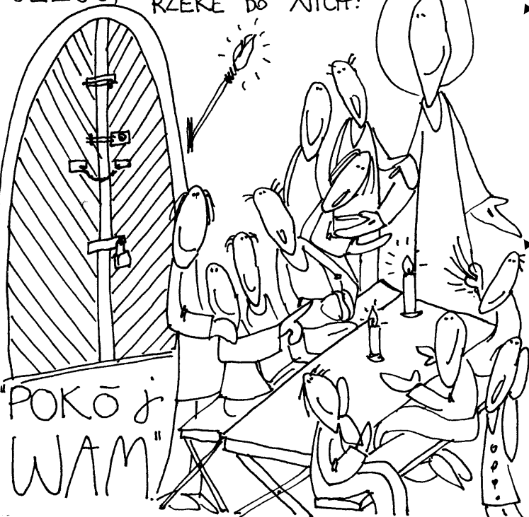
Ewangelia na niedzielę 07.04.2024r. J 20,19-31

WIECZOREM W DNIU ZMARTWYCHWSTANIA, TAM GDZIE PRZEBYWALI UCZNIOWIE, CHOĆ DRZWI BYŁY ZAMKNIĘTE Z OBawy PRZED ŻYDAMI, PRZYSZEDŁ JEZUS, STANĄŁ POŚRODKU I RZEKŁ DO NICh: