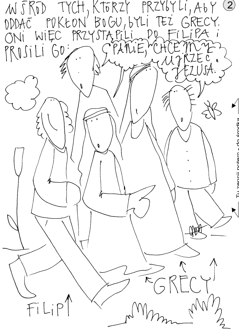
Ewangelia na niedzielę 17.03.2024r. J 12,20-33