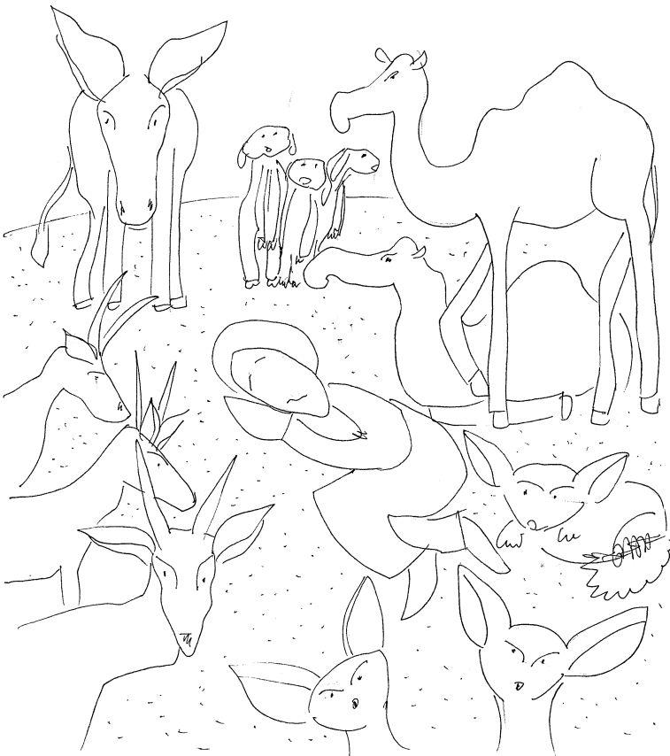
Tu zegnij najpierw - do rodka