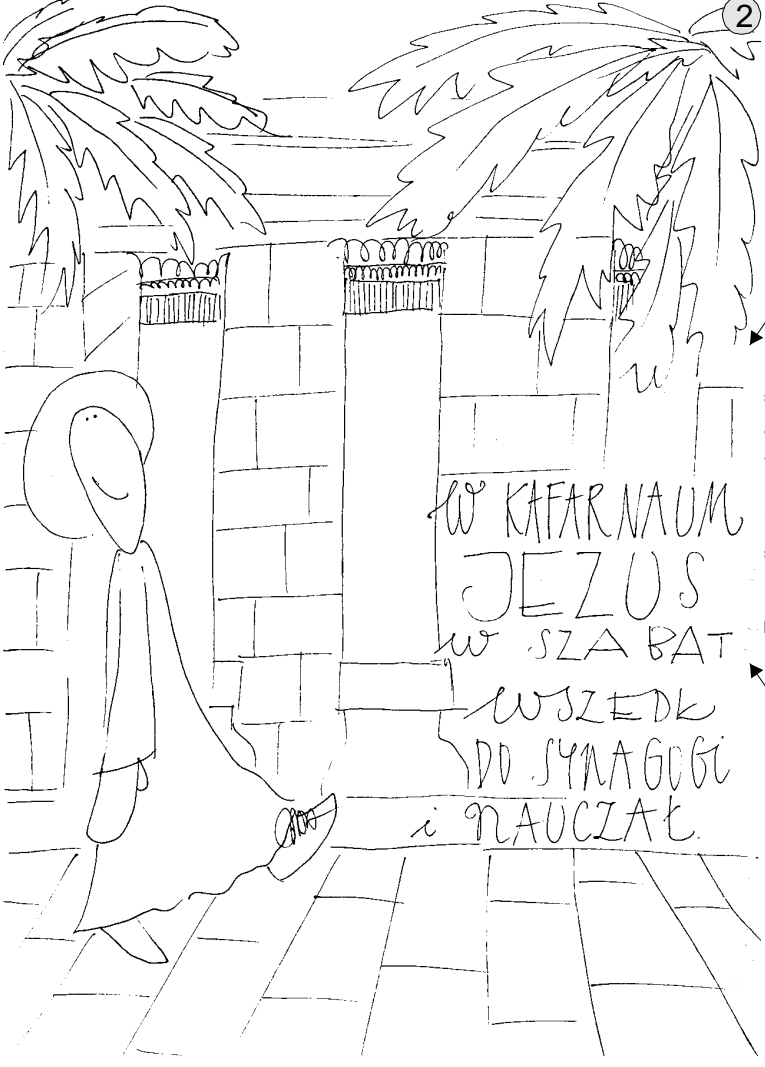
Ewangelia na niedzielę 28.01.2024r. Mk 1,21-28