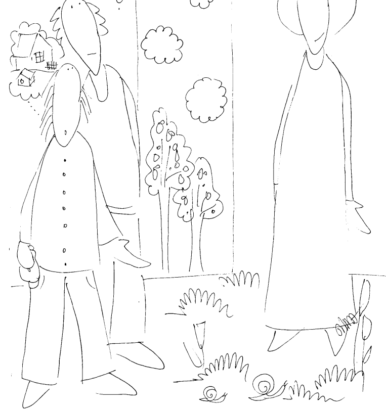
Tu zegnij najpierw - do rodka

5 NI POWIEDZIELI DO NIEGO: "RABBI! - TO ZNACZY NAUCZYCIELE - GDZIE MIESZKASZ?"