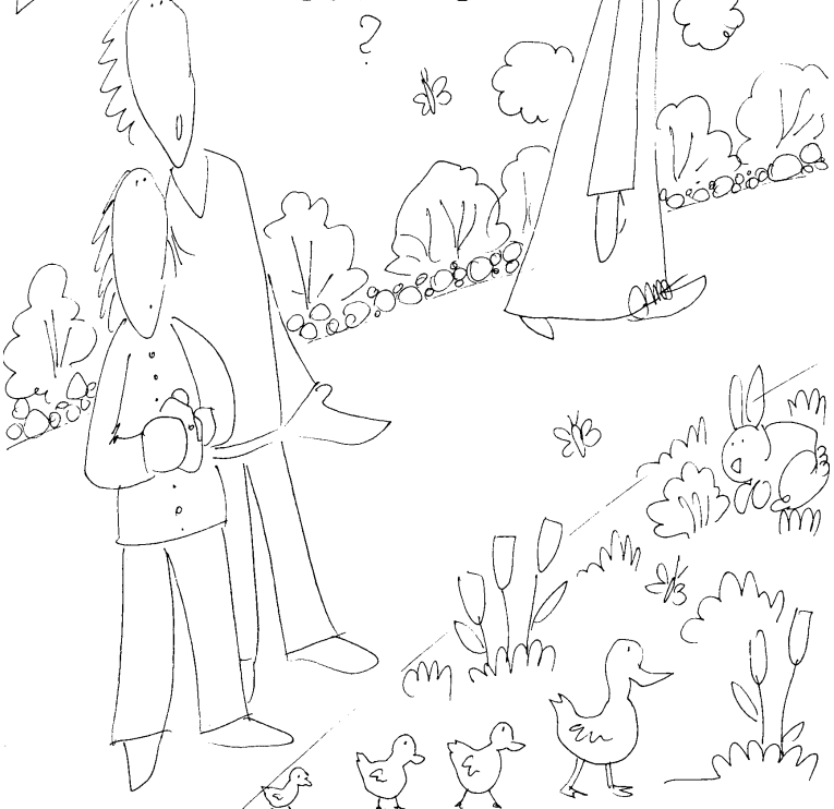
Tu zegnij najpierw - do rodka

JEZUS ZAŚ, ODWRÓCIWSZY SIĘ DO NICH, RZĘKŁ DO NICH: "CZEGO SZUKACIE?"