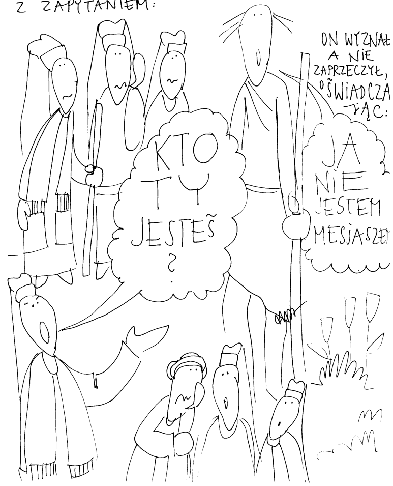
Ewangelia na niedzielę 17.12.2023r. J 1, 6-8, 19-28

③ TAKIE JEST ŚWIADECTWO JANA. GDY ŻYDZI WYSŁALI DO NIEGO Z JERUZOLIMY KAPŁANŌW I LEWITŌW Z ZAPYTANIEM: