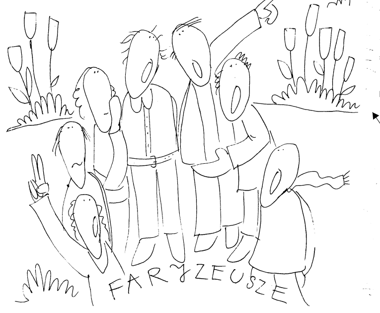
Ewangelia na niedzielę 22.10.2023r. Mt 22,15-21

POŚŁALI WIĘC DO NIEGO 3 SWOICH UCZNIÓW ZE ZWOLENNIKAMI RAZEM HERODA,