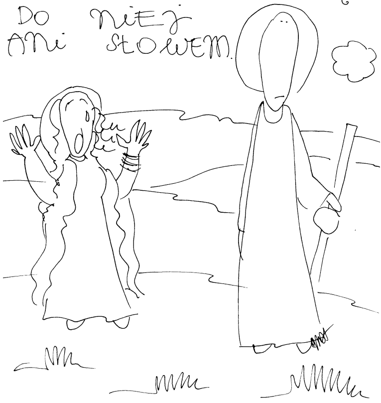
Ewangelia na niedzielę 20.08.2023r. Mt 15,21-28

LECZ ON 3 NIE ODEZWAŁ SIĘ DO NIEJ ANI SŁOWEM.