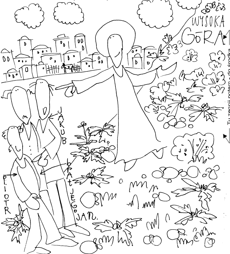
Ewangelia na niedzielę 06.08.2023r. Mt 17, 1-9

JEZUS WZIĄŁ Z SOBĄ ② PIOTRA, JAKUBA ORAZ BRATA JEGO, JANA, I ZAPROWADZIŁ ICH NA WYSOKĄ GÓRĘ, OSOBNA