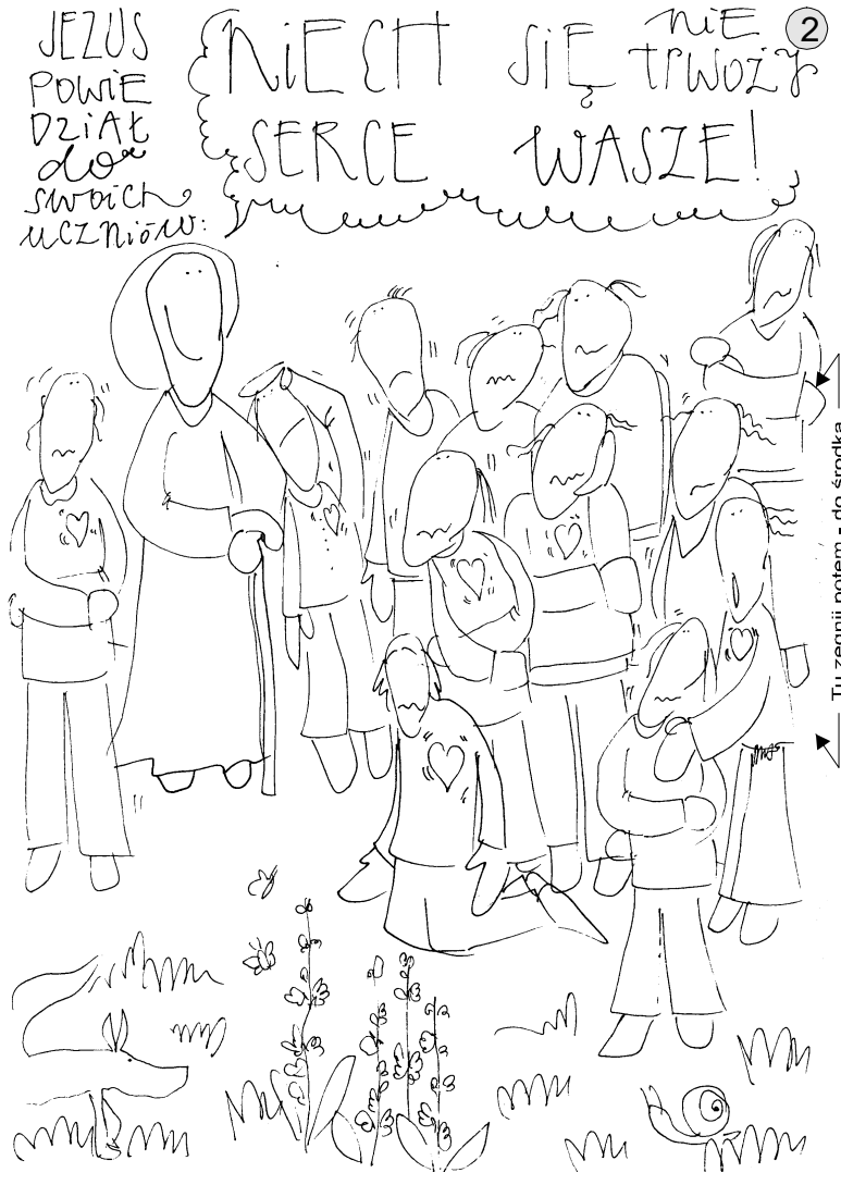
Ewangelia na niedzielę 07.05.2023r. J 14, 1-12