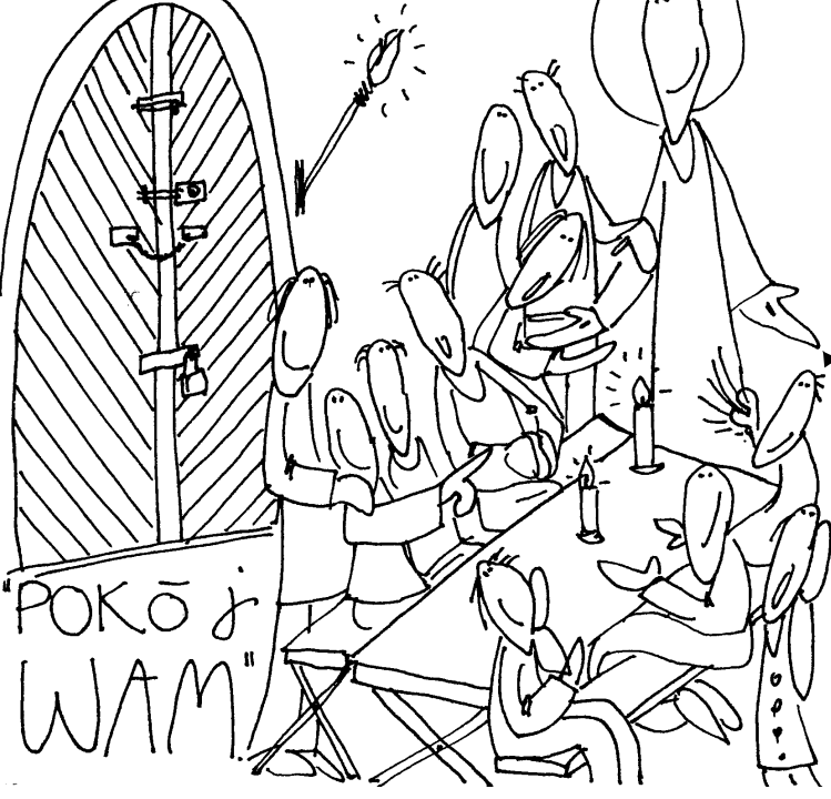
Ewangelia na niedzielę 16.04.2023r. J 20,19-31

WIECZOREM W DNIU ZMARTWYCHWSTANIA, TAM GDZIE PRZEBYWALI UCZNIOWIE, CHOĆ DRZWI BYŁY ZAMKNIĘTE Z OBawy PRZED ŻYDAMI, PRZYSZEDŁ JEZUS, STANĄŁ POŚRODKU I RZEKŁ DO NICH: