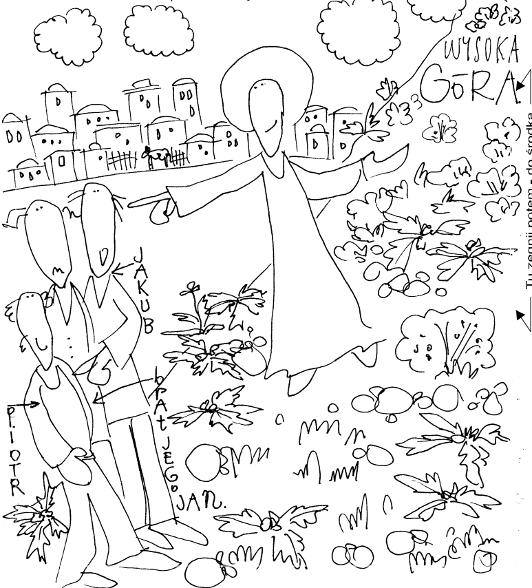
Ewangelia na niedzielę 05.03.2023r. Mt 17, 1-9

JEZUS WZIĄŁ Z SOBĄ ② PIOTRA, JAKUBA ORAZ BRATA JEGO, JANA, I ZAPROWADZIŁ ICH NA WYSOKĄ GORĘ, OSOBNA