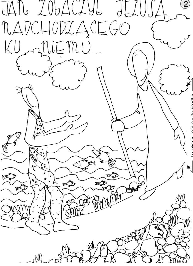
2 JAN ZOBACZYŁ JEZUSA NADCHODZĄCEGO KU NIEMU...