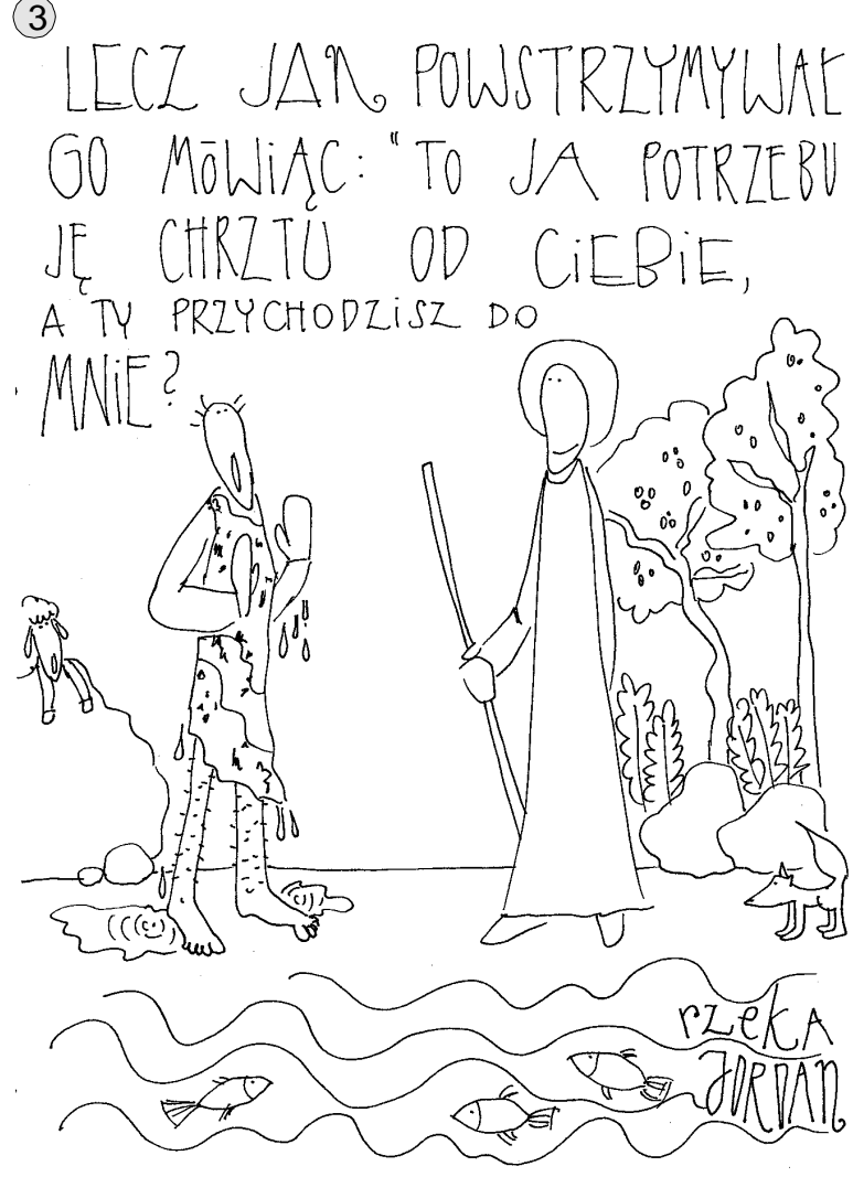
Ewangelia na niedzielę 08.01.2023r. Mt 3, 13-17

LE CZ JAN, POWSTRZYMYWAŁ GO MÓWIĄC: "TO JA POTRZEBUJĘ CHRZTU OD CIEBIE, A TY PRZYCHODZISZ DO MNIE?"