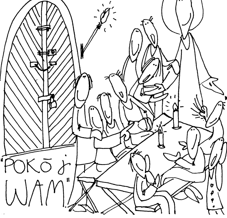
Ewangelia na niedzielę 24.04.2022r. J 20,19-31

WIECZOREM W DNIU ZMARTWYCHWSTANIA, TAM GDZIE PRZEBYWALI UCZNIOWIE, CHOĆ DRZWI BYŁY ZAMKNIĘTE Z OBawy PRZED ŻYDAMI, PRZYSZEDŁ JEZUS, STANĄŁ POŚRODKU I RZEKŁ DO NICH: